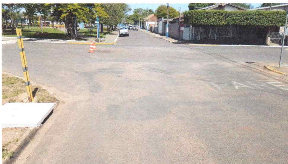
Foto da Área de Intervenção, no cruzamento da Avenida Leão Miguel Bannwart, esquina com a Rua Benjamin Constant.