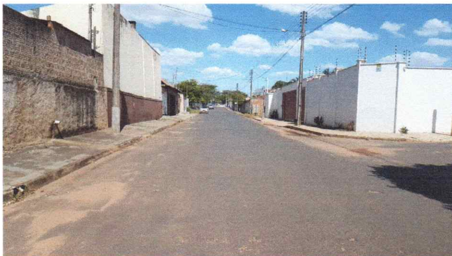
Foto da Área de Intervenção, Na Rua Benjamim Constant, no trecho entre a Avenida Leão Miguel Bannwart e a Rua Miguel Pereira da Silva.