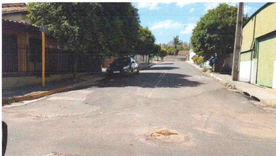
Foto da Área de Intervenção, Na Rua Miguel Pereira da Silva, no trecho entre a Rua Benjamim Constant e a Rua Vereador Luis Cassandre.