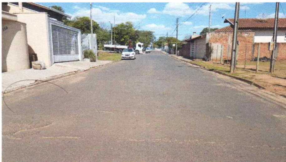
Foto da Área de Intervenção, Na Rua Benjamim Constant, no trecho entre a Avenida Leão Miguel Bannwart e a Rua Miguel Pereira da Silva.