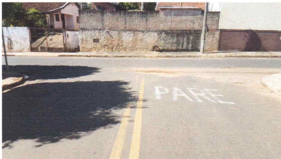
Foto da Área de Intervenção, no cruzamento da Rua Benjamin Constant, esquina com a Rua Miguel Pereira da Silva.