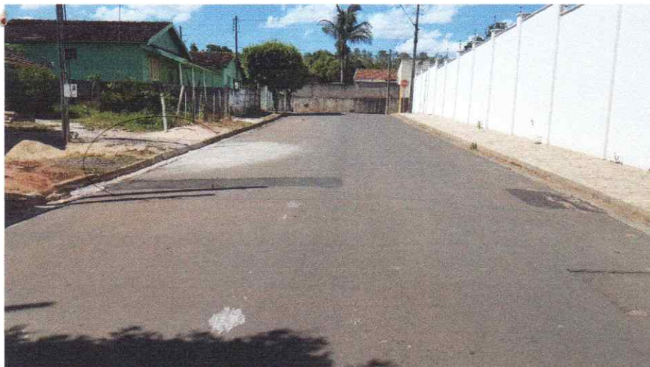
Foto da Área de Intervenção, Na Rua Miguel Pereira da Silva, no trecho entre a Rua Benjamim Constant e a Rua Vereador Luis Cassandre.