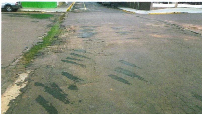
Foto 3 - Rua Vereador Luís Cassandre, trecho entre o cruzamento da Avenida Leão Miguel Bannwart e Rua Vereador Luís Cassandre.

Avenida Campos Salles, 113 – CEP 17760-000 - Inúbia Paulista - Estado de São Paulo.