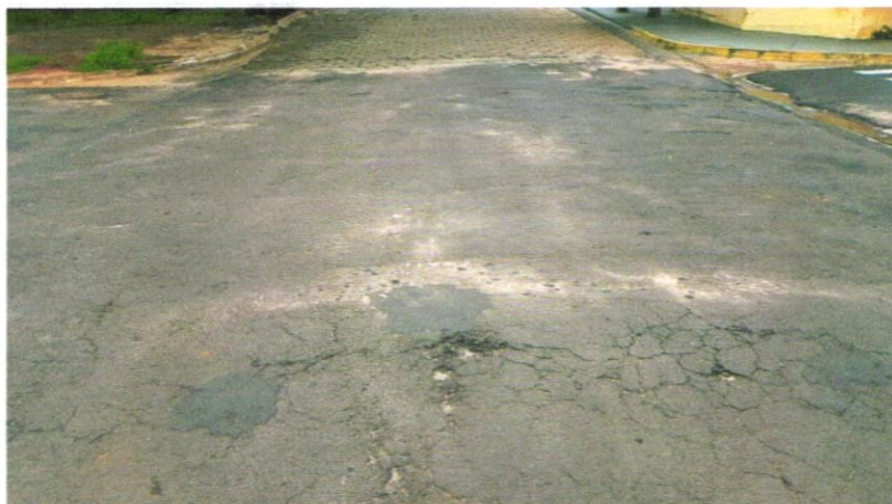
Foto 6 - Rua Vereador Luís Cassandre, trecho entre o cruzamento da Rua Iraldo Antonio Martins de Toledo com a Rua Vereador Luís Cassandre.

Avenida Campos Salles, 113 – CEP 17760-000 - Inúbia Paulista - Estado de São Paulo.