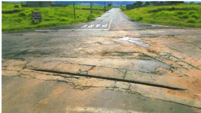
Foto 01 - Rua Benjamim Constant, trecho do cruzamento da Rua Antônio Ishihira com a Rua Benjamim Constant.