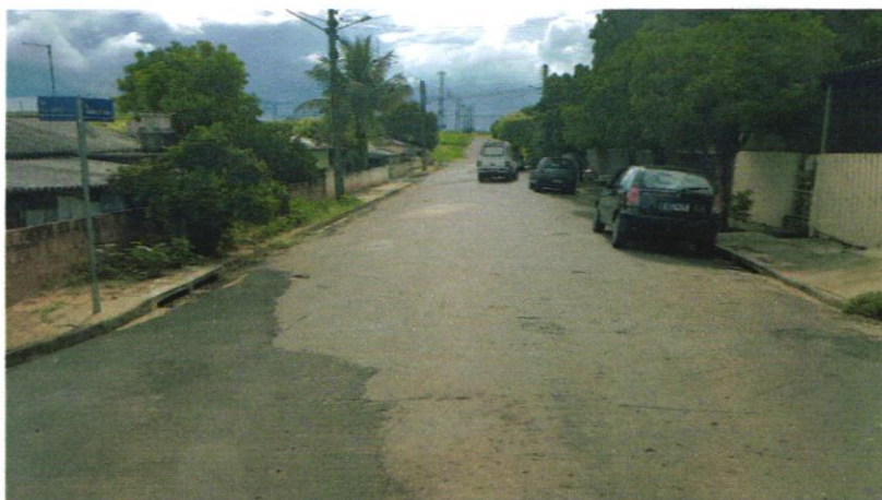
Foto 02 - Rua Benjamim Constant, trecho entre a Rua Antônio Ishihira e a Rua Sely Francisco Rocha.