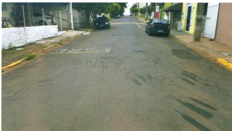
Foto 4 - Rua Vereador Luís Cassandre, trecho entre a Lombada indicada em Projeto até o cruzamento da Avenida Leão Miguel Bannwart.