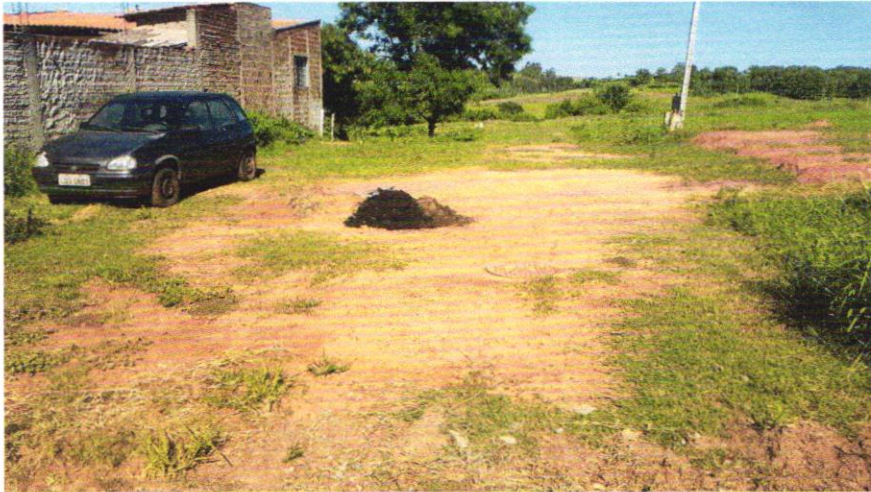
3- Rua João Gerônimo Lopes, entre a Av. Mar. Deodoro da Fonseca e a Rua Miguel Pereira da Silva

Avenida Campos Salles, 113 – CEP 17760-000 - Inúbia Paulista - Estado de São Paulo.