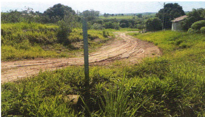
1 - Avenida João Elvino, entre a Rua Wenceslau Braz e a Rua Tibiriças