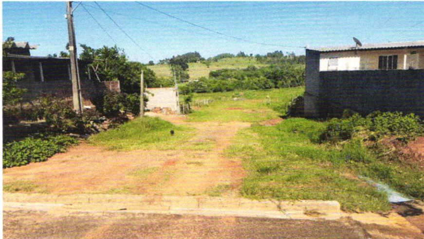
4- Rua Sebastião Pereira, entre a Av. Mar. Deodoro da Fonseca e a Rua Miguel Pereira da Silva